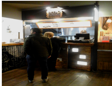
Fotografía 4. Fachada del establecimiento.