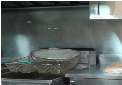
Fotografía 7. Freidora de 2 canastas a gas natural.