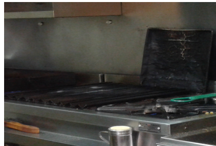
Fotografía 6. Parrilla y estufa de 2 puestos a gas natural.