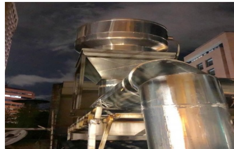
Fotografía 8. Ducto y sistema de extracción.