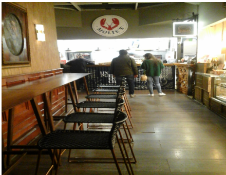
Fotografía 3. Interior de la plazoleta de comidas