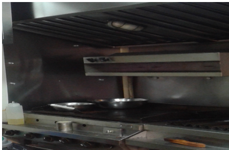
Fotografía 5. Plancha y salamandra a gas natural.